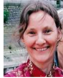
Zum Autorenprofil von Yamuna